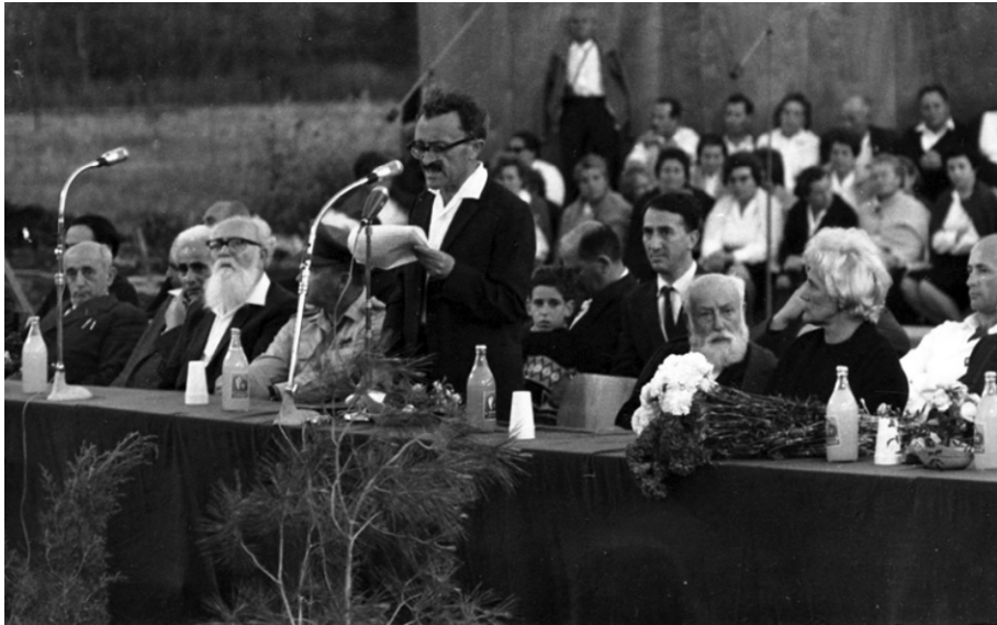
צבי שזר נואם בעצרת הזיכרון בבית לוחמי הגטאות, משני צדיו יושבים יצחק טבנקין והרמטכ"ל, יצחק רבין, 29 באפריל 1965.

שזר אמנם הבטיח לחימה, אך ככל הנראה הבין כי הקרב כבר נגמר. בריאיון לעיתון המקומי לאחר העצרת הוא נמנע מלהזכיר את הנושא והעדיף לתאר את המבקרים הרבים הפוקדים את המוזיאון. 32 במקביל הדגיש את קול המצפון והמוסר ביחס לגרמניה, ולחבר הקיבוץ המאוחד שתכנן לנסוע לאזכרה במחנה בוכנוולד כתב: "דעתנו איננה נוחה מביקורים פרטיים בגרמניה". 33 נוסף על כך הוא דחה בקשה לשימוש בחומרים של ארכיון המוזיאון בסרט שהופק על היחסים בין שתי המדינות ונעתר רק לאחר ששוכנע שאין בסרט מסר של פיוס. 34