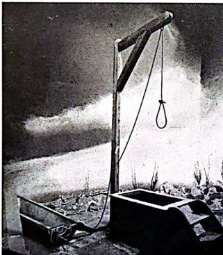
Execution stake and automatic trap from Struthof camp