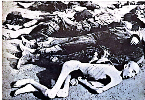
תמונה 7. קטלוג התערוכה "פשעי הנאצים" 33

אנחנו מעמידים כאן את התערוכה "פשעי הנאצים" כנגד התערוכה "החיפוש אחר הנעדרים". "פשעי הנאצים" הייתה תערוכה אנטי-פשיסטית, שעיקרה דימויים של מוות, לרוב כמעט בלי הקשר, ואילו "החיפוש אחר הנעדרים" התעניינה בעיקר בבעיית האיתור של מי שאבדו עקבותיהם, ואפשר לומר שהושם בה דגש על "החזרה לחיים". "פשעי הנאצים" ביקשה לזעזע את המבקר בדימויים ובחפצים של עינוי ורצח, כמעט בלי להסביר את ההיסטוריה שלהם, ואילו "החיפוש אחר הנעדרים" סיפקה תיאורים מפורטים של