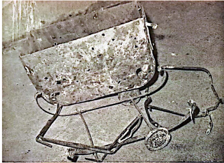
Relics from Oradours-sur-Glane (objects found in the church after the massacre)

האחרונות של ההולכים למות". את הגישה האמוציונלית, שקיבלה ביטוי בקולאזים של תצלומי תקריב של גופות, העצימה הצבת הלוחות האלה בסמיכות לחפצים מהכפר אורדור-סור-גלאן (Oradour-sur-Glane), שהוחרב עד היסוד, לכרזות גיוס לעבודה בגרמניה או לגרדומים ממחנה הריכוז נצוויילר-שטרוטהוף (Natzweiler-Struthof) (תמונה 7).