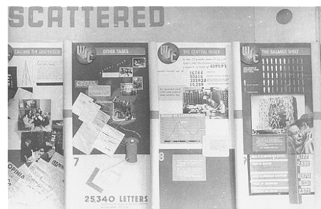
תמונות 2-5. תצלומים של התערוכה "החיפוש אחר הנעדרים".

גדרות התיל מסמנות את ראשית ההתפתחות של איקונוגרפיית השואה מן הסוג שרואים בתערוכות, אנדרטאות, יצירות אומנות וייצוגים אחרים משנת 1945 ואילך. 21 הלוח השני מראה את "יום השחרור": קהל רב מתאסף סביב אנדרטה, ויד מעוצבת מושטת אל עבר שורדים ליד גדר תיל. לאחר מכן מוצג הלוח "נראה לאחרונה...", המראה שטף של מכתבים, כנראה לבירור מקום הימצאם של נעדרים. הקונגרס היהודי העולמי תיאם שירות דואר מיוחד שכונה "מכתבים לאירופה" על מנת לתגבר את שירותי הדואר הסדירים, שעדיין לא שבו לתפקוד מלא. על פי דוח שפרסם הקונגרס בפריו ב-1948, שירות זה סייע לאחד כ-5,000 ניצולים עם בני משפחותיהם. 22 הטכניקות החזותיות הנראות כאן – בייחוד הקולאז', המעמיד זה לצד זה יסודות רבים ומרמז על קיטוע ובלבול – מלמדות שהתערוכה לא רק שיקפה את רוח זמנה, אלא גם מצאה אסתטיקה מודרניסטית, מאחה, שהלמה את המאורעות שתארה.