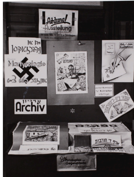
תמונה 10. חלק מתצוגת הוועדה ההיסטורית של גטינגן בתערוכה "אונדזער וועג אין דער פרייהייט", 1947, תצלום שחור לבן.

בתערוכה הוצג עוד צד של הפעילויות במחנה העקורים בנוישטט: שיעורים ללימוד מקצוע שארגנו בתי ספר של "הארגון לשיקום באמצעות הכשרה" (אורט). יש תצלומים של בתי מלאכה וכיתות שבהם יכלו אנשים צעירים לרכוש מיומנויות מעשיות נחוצות.