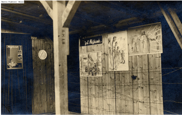
תמונה 4. פנים הבית היהודי (ציור של אסירות במיידנק), 1946, תצלום שחור לבן. ארכיון בית לחמי הגטאות, מספר מחשב 38514

אבל גם קובע את עמדתו של הצופה, שכן הוא אינו מאפשר לו להתקרב לציורים, אולי אפילו מונע ממנו לאמץ עמדה מציצנית. זאת ועוד: הציורים ממוקמים בקצה הצרף, ממסגרים את האנדרטה משני צידיה ומדגישים את הנראות שניתנה לצורות שונות של חוויה נשית.