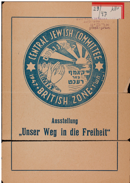
תמונה 7. הזמנה לתערוכה "אונדזער וועג אין דער פרייהייט" ("דרכנו אל החופש"), 1947, הדפסה על נייר. YIVO Archives, RG 294.5, Folder 46

את התערוכה ארגן אולבסקי, אבל צבי הורוביץ, ראש הוועדה ההיסטורית בגטינגן, תרם רבות לעבודת האוצרות של החלקים ההיסטוריים (תמונה 7). 51