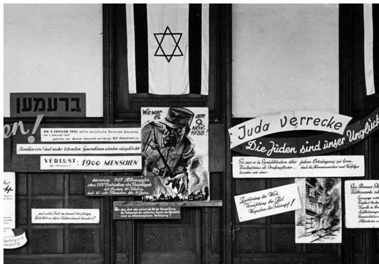
תמונה 11. חלק מהתערוכה "אונדזער וועג אין דער פרייהייט" שיוחד לעיר ברמן, 1947, תצלום שחור לבן.

נובמבר 1938 (ליל הברדולח); הוא כלל לוחות שונים שהציגו עדויות על היקף האלימות נגד היהודים ועימתו את הגרמנים עם אשמתם. תמונות העיר הבוערת ייצגו את אירועי 1938, והוכנסו להקשר באמצעות נתונים סטטיסטיים על השואה. מתחת לשם העיר ברמן נכתב שבינואר 1933 מנתה הקהילה היהודית המקומית 2,000 נפשות, וב־1947 נשאר בה רק 100 ניצולים. כיתובים אחרים עוצבו בסגנון גרפיטי וכללו סיסמאות אנטישמיות כמו "Juda Verrecke" ("מות, יהודה"), חלק משיח שנאה אנטישמי שהופיע במרחב הציבורי של ערים רבות בזמן הפוגרום. 69 הסבר כתוב ציין כמה נפוצות היו סיסמאות כאלה והבהיר: "היה אפשר לקרוא זאת על כרזות מעל כל כניסה לכפר, על מצבות ואפילו על מדרכות" (תמונה 11). 70