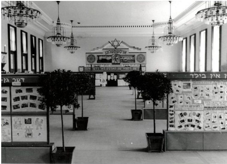
תמונה 9. מראה כללי של התערוכה "אגנון" וועג אין דער פרייהייט", 1947, תצלום שחור לבן.

רפרודוקציות; לרוב הם כיסו קירות שלמים ויצרו דפוסים ריתמיים. דרך ההצגה הזאת שיחקה במושגים של קנה מידה ושינתה את אופן התפיסה של המסמכים – מתפיסה של הקומפוזיציה כולה להתמקדות בייחודיות ובקריאות של פריט ארכיוני מסוים. היא