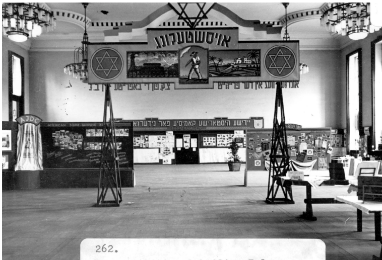
תמונה 8. מראה כללי של התערוכה "אגנון" וועג אין דער פרייהייט", 1947, תצלום שחור לבן. ארכיון יד ושם, אוסף התצלומים, פריט 19078