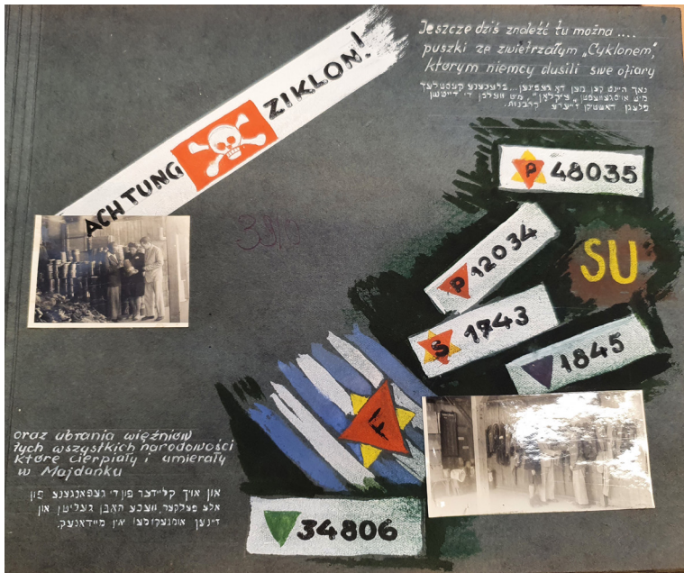
תמונה 2. תצוגת פריטים בכניסה לביתן היהודי. המוזיאון היהודי במיידנק, 1946, אלבום תמונות, ŻIH, ŻIH-ALBU-43, p. 4. למעלה נכתב: "עד היום אפשר למצוא כאן מכלים של גו הציקלון ששימש את הגרמנים להמתת קורבנותיהם בחנק", ולמטה: "וכן בגדים של אסירים מכל הלאומים שסבלו במחנה מיידנק ומתו בו"