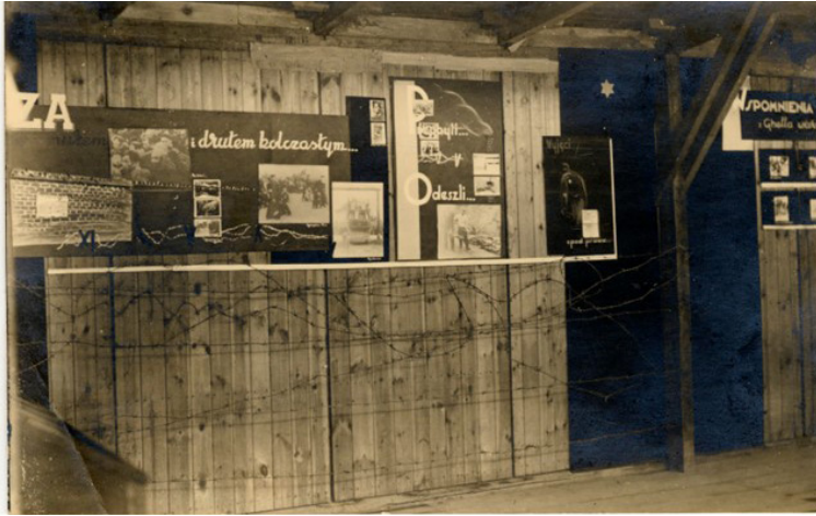
תמונה 6. פנים הביתן היהודי, 1946, תצלום שחור לבן. ארכיון בית לוחמי הגטאות, מספר מחשב 38517

יוצרי התערוכה צירפו אפוא יחד מקורות חזותיים וטקסטואליים מגוונים שנכחו באותו זמן במרחב הציבורי, רובם מעשה ידיהם של ניצולים. התערוכה הייתה מעין עבודה משותפת של דמיון מחודש ושל הנצחה, התמודדות עם פְּשֵׁרָה של ההיסטוריה ועם ייצוגיה ושיקוף של האווירה התרבותית ששררה לאחר המלחמה. זה היה רגע של יצירת שפה ושל התהוות סמלים ואיקונוגרפיה שבתוך כמה עשרות שנים יזוהו מפורשות עם השואה. עם זאת, ההנכחה החזותית של הסבל והאבל של היהודים לא הייתה רק עניין של תיאור סמלי וחזותי; היא הייתה גם מעשה פוליטי מובהק. אחת הכתובות בתערוכה קבעה: "האנטישמיות היא בעלת ברית נאמנה של הפשיזם". אם מביאים בחשבון את קרבתה ועוצמתה של האלימות נגד היהודים בזמן ההוא, ברור שהטקסט הזה עסק לא רק בעבר אלא גם בהווה. 36