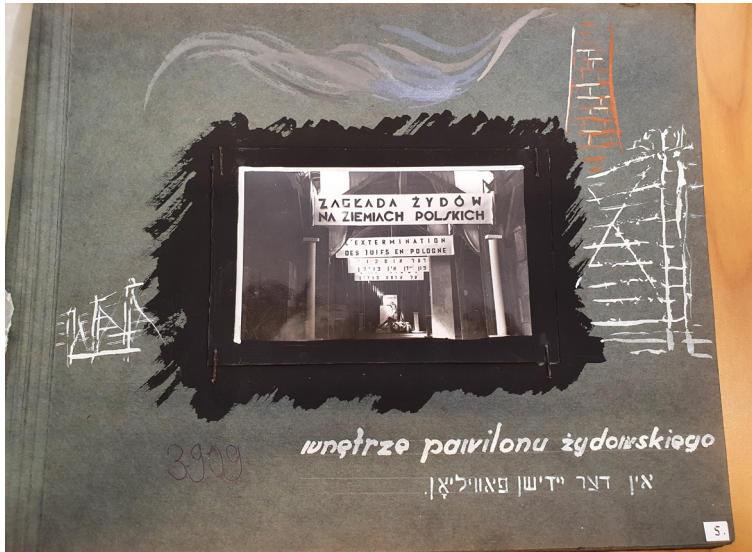
תמונה 3. פנים הביתן היהודי. המוזיאון היהודי במיידנק, 1946, אלבום תמונות, ŻIH, ŻIH-ALBU-43, p. 5

מראה מכובד. ביצירת הרושם האסתטי הזה הושקעו מאמצים יצירתיים רבים. חומרים טבעיים איכותיים כגון שיש או אבן מן הסתם לא היו זמינים בעת ההיא. כדי להשיג רושם דומה השתמשו בחומרים פשוטים יותר, והניסיון להתגבר על המחסור מעיד על נחישות לפרוץ את גבולות אדריכלות המחנה וליצור חלל מכובד שיאפשר אבל.