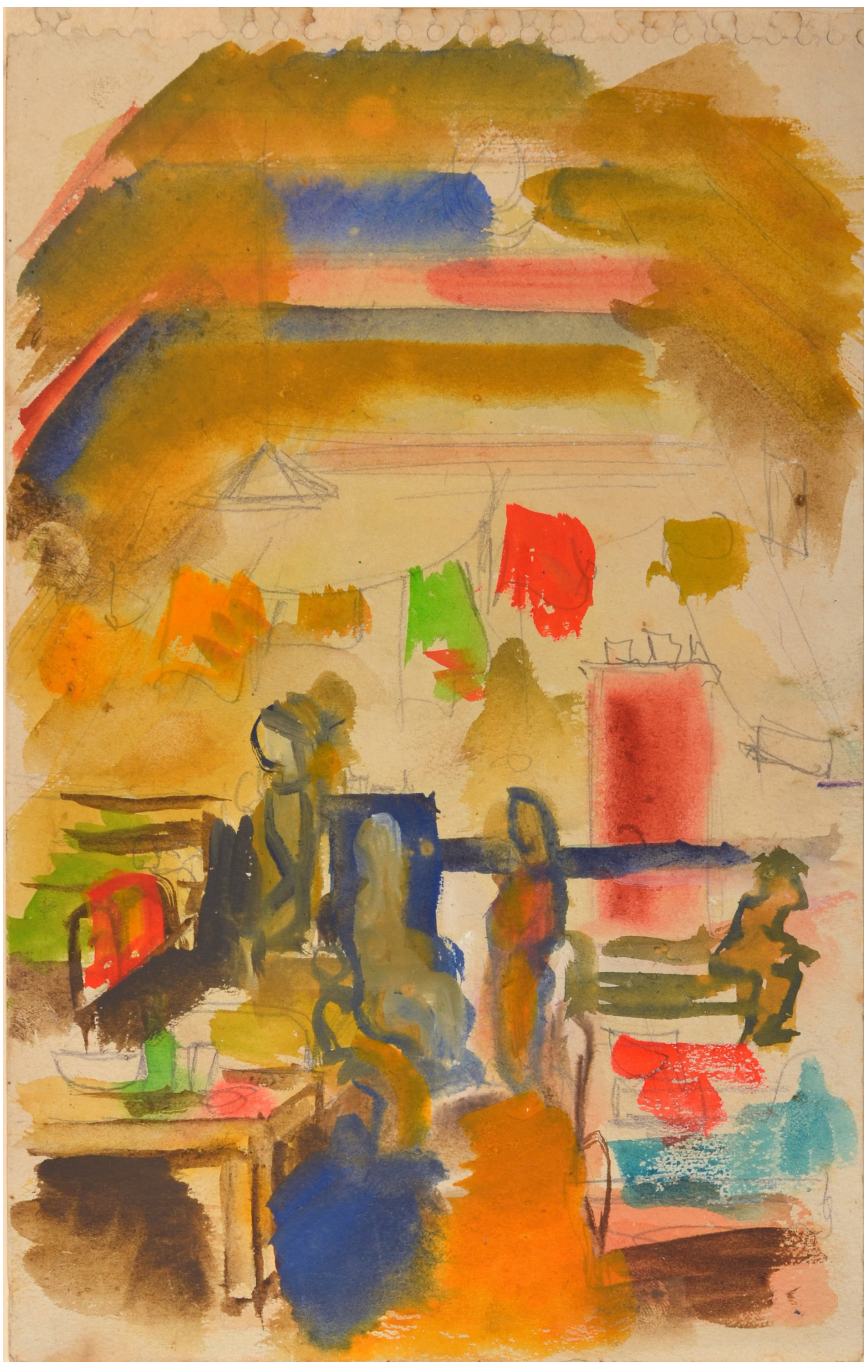
לאון לנדאו, "פנים חדר שינה", צבעי מים, 13.5x21.5 ס"מ. מ. אבלה"ג, אוסף האומנות, 142