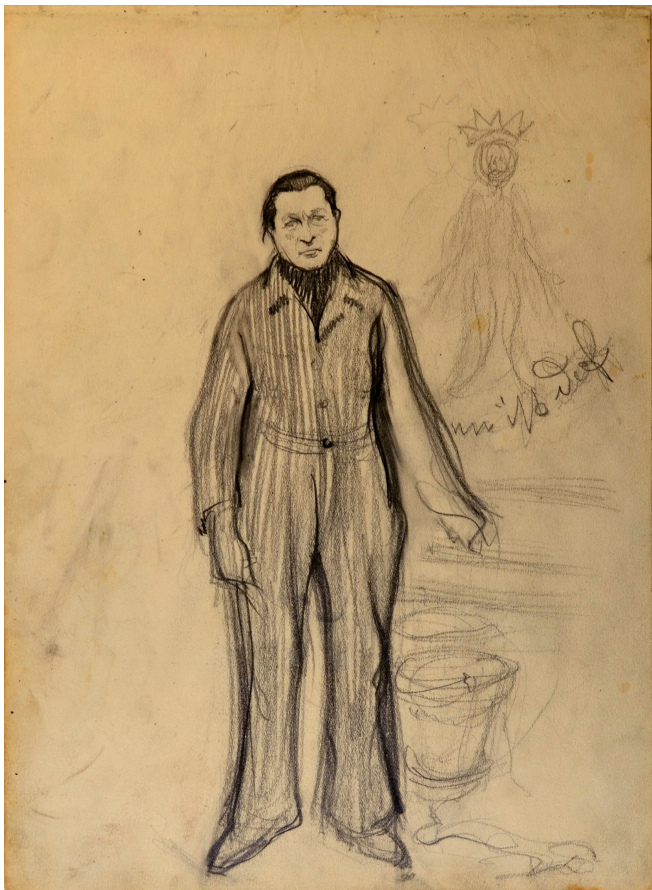
אירן אברט, "הברון הרברט פון לדרמן־זורטברג – אסיר בסרבלי", רישום בעיפרון, 18.2x24.5 ס"מ. אבלה"ג, אוסף האומנות, 128