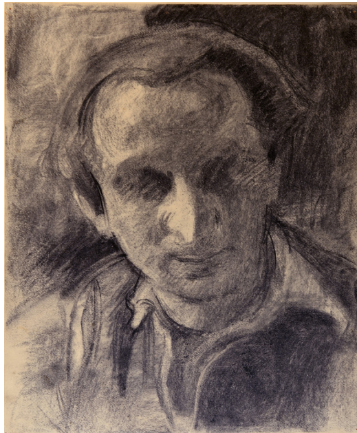
אירן אברט, "לאון לנדאו – דיוקן", רישום עיפרון, 32x26.7 ס"מ. אבלה"ג, אוסף האומנות, 113

בעבודות שתרמה אברט יש שבע עבודות נייר של האומן לאון לנדאו. לנדאו נולד ב־1910 באנטוורפן. בצעירותו עבד כמעצב תלבושות ותפאורות בתיאטרון המלכותי באנטוורפן, ובשנות השלושים היה חבר בתנועת האומנים "אוונגרד". בשנת 1936 התגייס לצבא הבלגי ושירת בחיל התותחנים. לאחר שחרורו התיישב בבריסל והצטרף לארגון קומוניסטי. בינואר 1943 נעצר בבריסל ונכלא במחנה מכלן. לצד עבודה בסדנת האומנים וציור במחתרת הוא יצר 12 מריונטות והצליח להפעיל תיאטרון בובות לטובת הילדים שהיו כלואים במחנה. גם לנדאו, שציורו "פנים חדר שינה" הוצג לעיל, תיאר את חי המחנה ואת חבריו האסירים, 21 אך שלא כמו אברט, הוא לא ציין את שמות המצוירים, ועל כן אי אפשר להתחקות על קורותיהם. גם את פניו של לאון לנדאו אנו פוגשים ברישום בעיפרון של אירן אברט. עיניו מטושטשות והרקע שמאחוריו מושחה. באפריל 1944 גורש לנדאו לאושוויץ. מאושוויץ הוא יצא בצעדת מוות למאוטהאוזן ולברגן-בלזן, ושם שוחרר באמצע אפריל 1945. לאחר שחרור המחנה נשאר לנדאו במחנה העקורים שהוקם במקום והתנדב לעבוד בבית החולים שלו. כאשר סעד חולי טיפוס, נדבק במחלה גם הוא והלך לעולמו בתאריך לא ידוע. בדיוקנו של לנדאו ובציוריו שהצליחה להציל הקימה אברט אנדרטה אומנותית לזכר חברה למחנה. זוהי דוגמה אחת מני דוגמאות רבות, המדגישה את חשיבות התיעוד האומנותי המחתרתי שנעשה בסדנת האומנים שבמחנה.